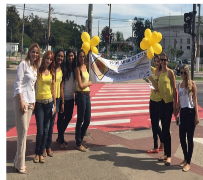
← Matéria Jornal Metro

Alunos de Fonoaudiologia da Ufes fizeram ontem, Dia Internacional de Conscientização sobre o Ruído, ações focadas no barulho provocado por veículos. Entre as consequências do problema estão estresse, perda auditiva e dor de cabeça. | CRISTO GUERES